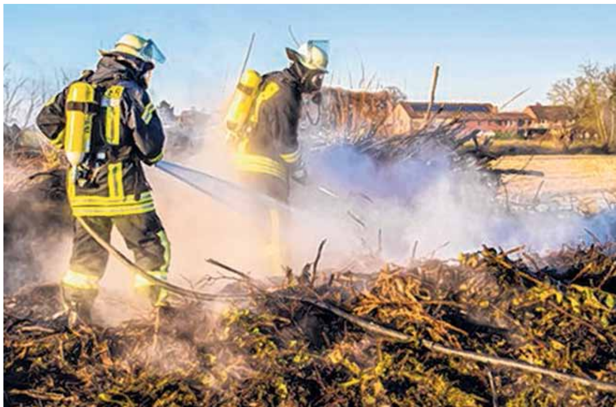
Sie helfen, wenn's brennt: Die Bedingungen für ehrenamtliche Feuerwehrleute werden verbessert.

Die Rahmenbedingungen des ehrenamtlichen Engagements für die Gemeinschaft werden weiter verbessert und familienfreundlicher gestaltet, vor allem werden verbesserte Freistellungsmöglichkeiten bei gleitender Arbeitszeit und flexiblere Beurlaubungsregelungen eingeführt. Künftig sollen Ehrenamtliche einen ausdrücklichen Rechtsanspruch gegen die Gemeinde auf Erstattung aller ihnen wegen des Feuerwehreinsatzes entgangenen Einnahmen und Sozialversicherungsleistungen haben. Auch der Ersatz nachgewiesener Kosten für die Betreuung von Kindern und pflegebedürftigen Angehörigen wird ermöglicht. Das sind