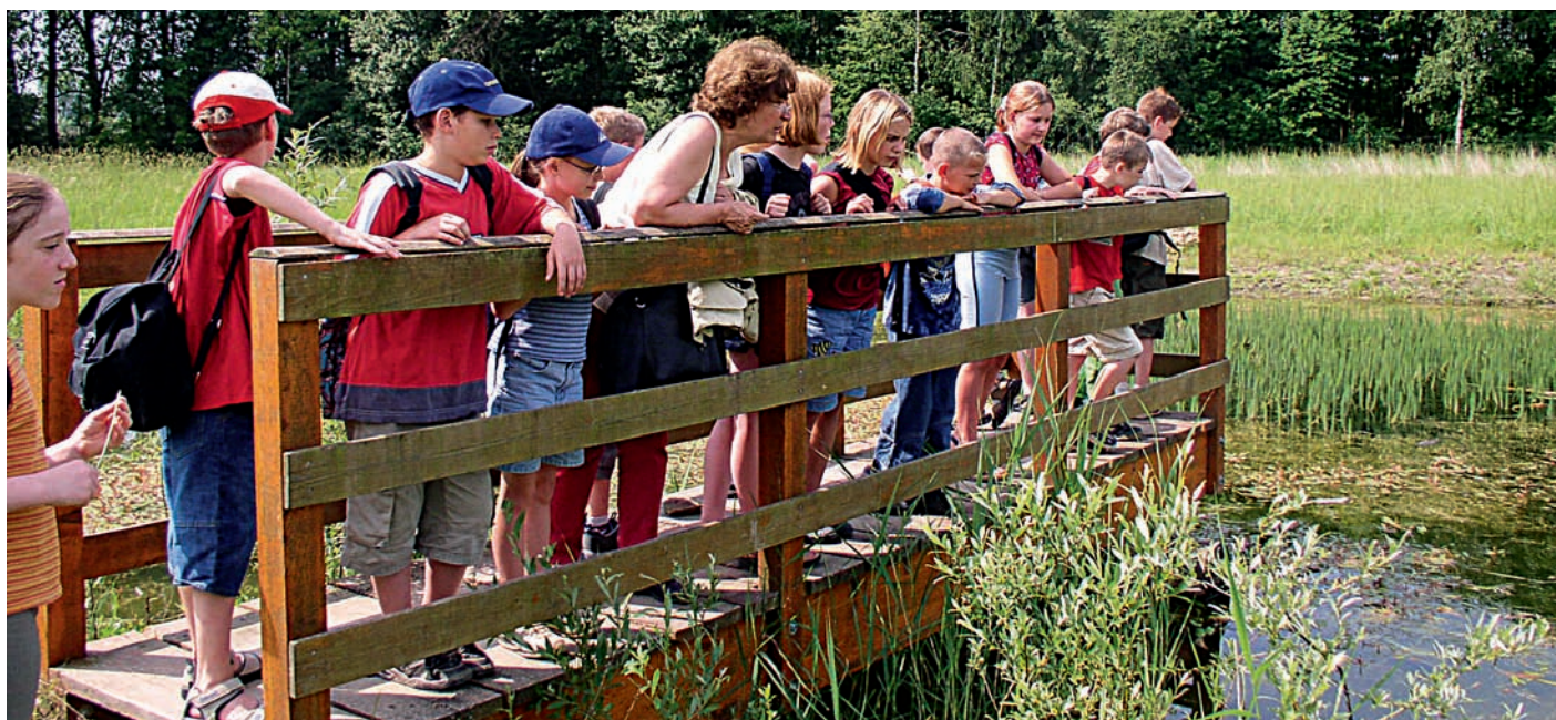
Eine Gruppe mit Jugendlichen nutzt den Lehrpfad.

Der inzwischen 15 Jahre alte Ökolehrpfad ist nach wie vor ein beliebtes Ausflugsziel im Guntersblumer Unterfeld am Rhein. Damit der Lehrpfad auch weiterhin attraktiv und vor allen Dingen sicher für die zahlreichen Besucher bleibt, investiert die Wasserversorgung Rheinessen-Pfalz GmbH ( wvr ) regelmäßig in den Erhalt des Lehrpfades. So wurde inzwischen die Brücke über den Leitgraben erneuert, der Steg an einem Tümpel durch heimisches Lärchenholz nachhaltig saniert und die Tafeln des Lehrpfades ersetzt.