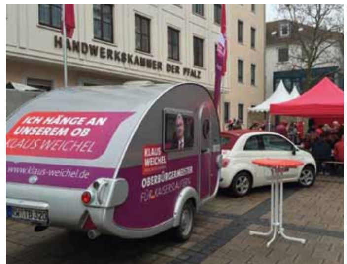
Das Wahlmobil war ein gutes Kommunikationsmittel.