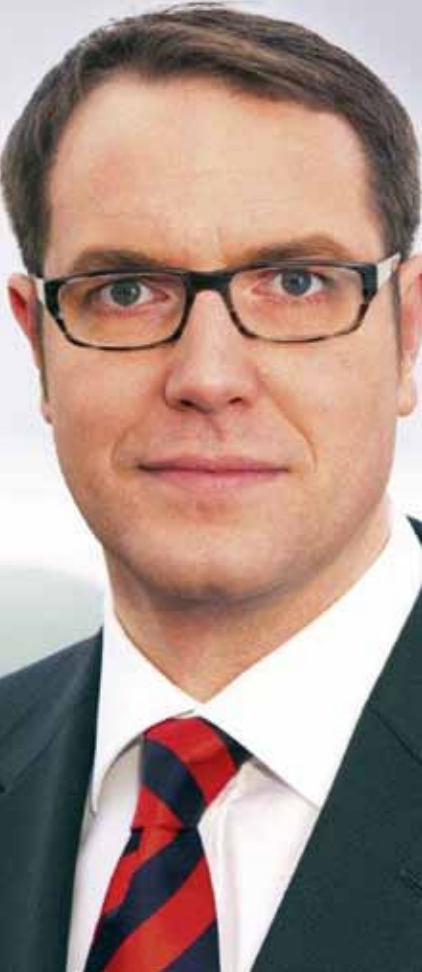
Alexander Schweitzer